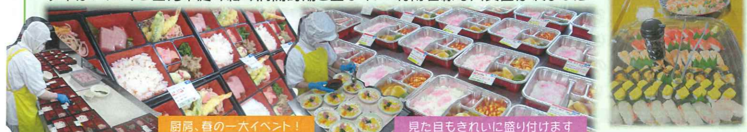
厨房、春の一大イベント！