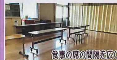
食事の席の間隔を広くしています

各部署で、工夫を行っています。お食事の際には、隣との間隔をあけて安心して食べて頂けるように工夫をしています。