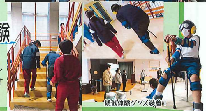
疑似体験グッズ装着!

豊栄社協と豊邑苑、能良の里合同で福祉交流活動を行いました。中学生に高齢者の疑似体験を通して理解を深めたり、自分達の町について考えたりする機会を提供しました。