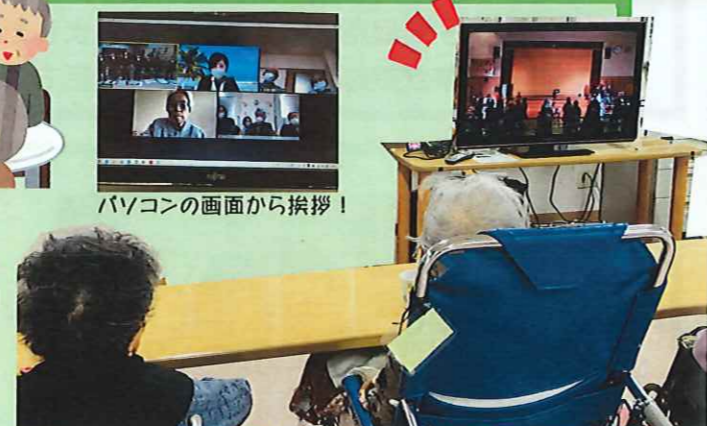
パソコンの画面から挨拶!

豊栄小学校とZOOMでつながり、各部署のご利用者様は、子供たちの音楽演奏を楽しんだり質問等に答えたりしながら楽しく過ごされました。また、学習発表会のビデオ鑑賞もされました。