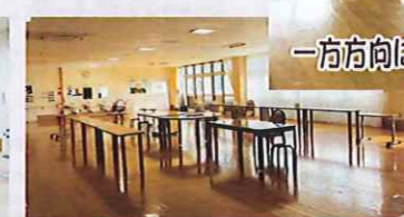
一方方向に向けて食べて頂いています。