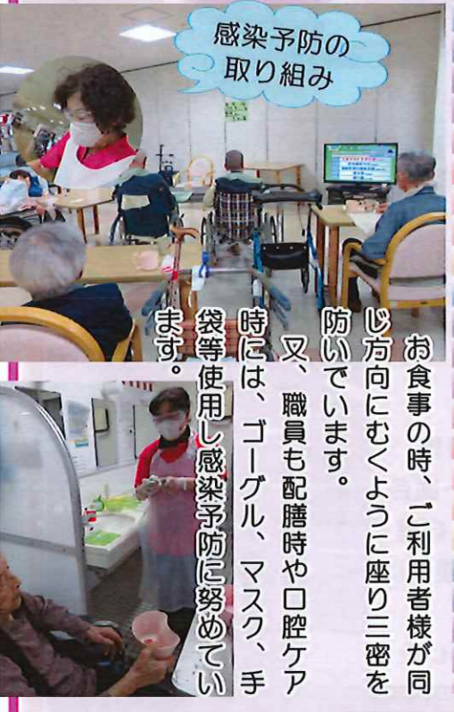
感染予防の取り組み

お食事の時、ご利用者様が同じ方向にむくように座り三密を防いでいます。 又、職員も配膳時や口腔ケア時には、ゴーグル、マスク、手袋等使用し感染予防に努めています。