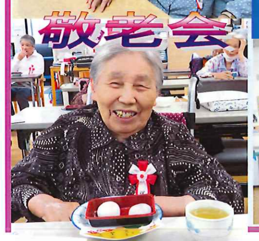
104歳餅つき 元気ですよ