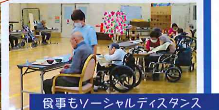
食事もソーシャルディスタンス