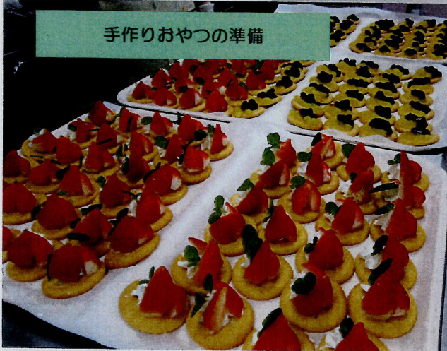
手作りおやつの準備