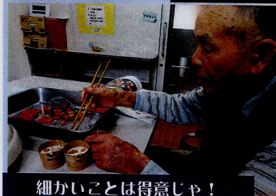
細かいことは得意じゃ！