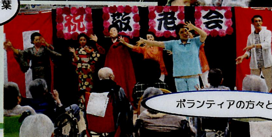
ボランティアの方々と