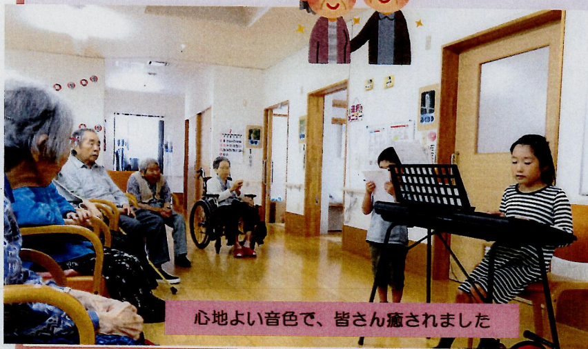
心地よい音色で、皆さん癒されました