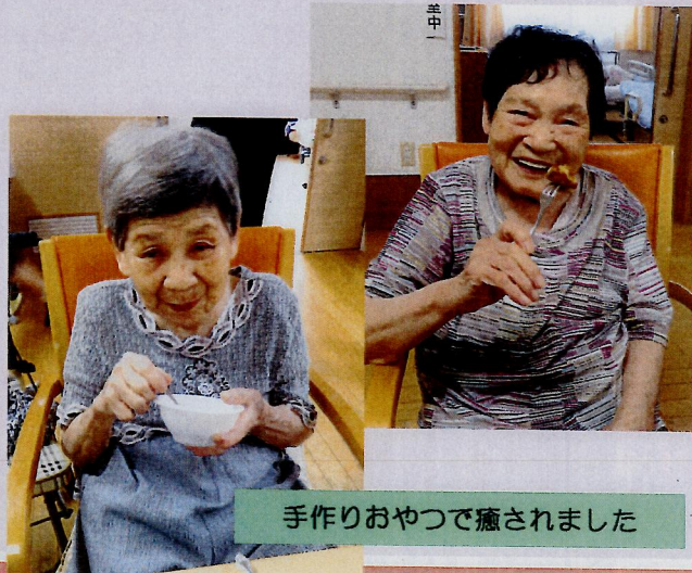
手作りおやつで癒されました