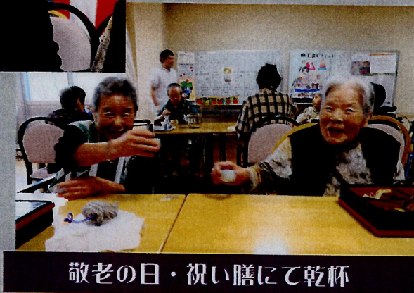
敬老の日・祝い膳にて乾杯

ケアハウス豊邑では、今年百歳を迎えられた方がおられます。百歳という節目の歳をこのケアハウスで迎えて頂き感謝です。 さらに、入居者の皆様が今日から明日、明日から明後日と一日一日を過ごしていただける事、感謝の一言につきます。